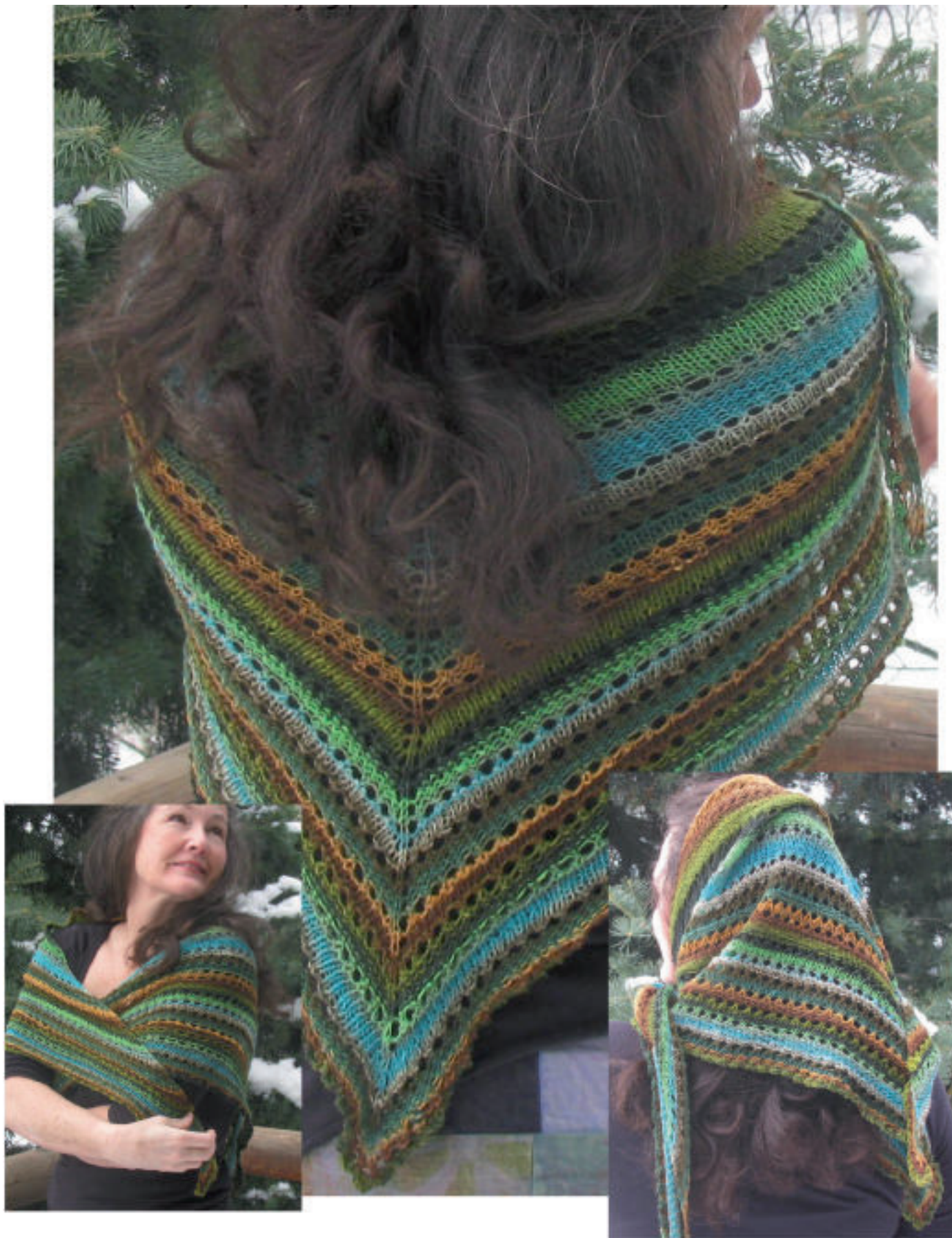
Châle réversible triangulaire Gaia par Anne Carroll Gilmour