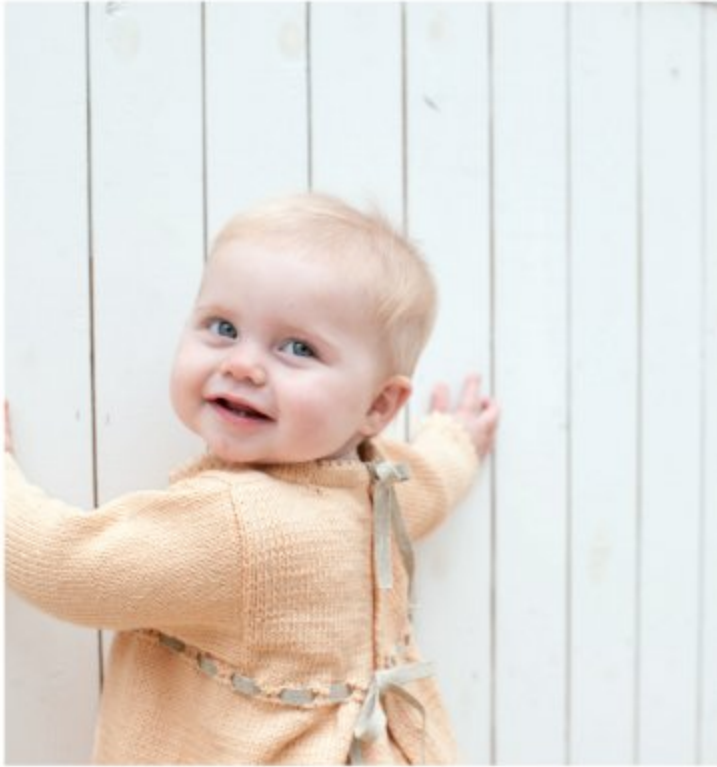
B robe à ruban & culotte explications page 48